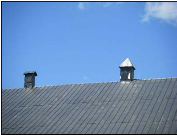
Évents disposés sur la ligne faîtière d'un bâtiment agricole situé au 485, rang Saint-Nicolas, Saint-Irénée.

Un certain nombre de campaniles, de lanterneaux et d'évents plus ou moins élaborés sont visibles sur l'ensemble du territoire de la MRC de Charlevoix-Est. Ces éléments architecturaux sont visibles notamment sur les chemins du Gros-Ruisseau et de la Vallée, à La Malbaie, ainsi que sur le rang Saint-Nicolas, à Saint-Irénée.