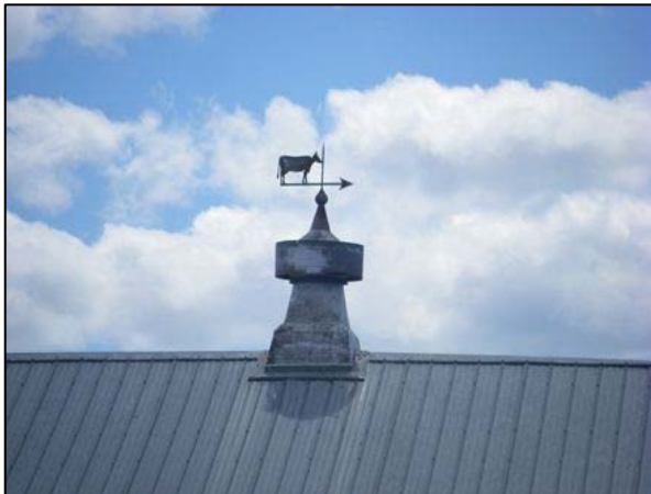
Évent doté d'une girouette visible au 70, chemin du Gros-Ruisseau, La Malbaie.