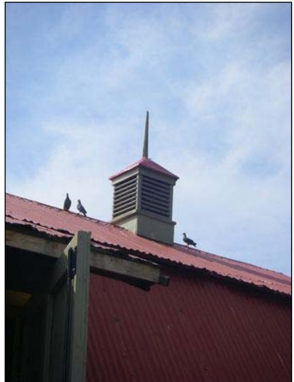
Lanterneau visible au sommet d'une grange-étable localisée au 114, chemin de la Vallée, La Malbaie (Rivière-Malbaie).